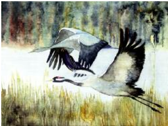
Majestätisch, 2013, Aquarell auf Papier, 36 x 48 cm

Erst Anfang bis Mitte August sind sie wieder in kleinen Gruppen zu sehen. Dann kommt bald die Zeit, wo sie sich an ihren Sammelplätzen zu tausenden einfänden. Im Herbst, wenn dann die Kraniche auf dem Weg von Skandinavien in den Süden, zwischen Rügen und Fischland Darss Rast machen, klingt das Kranichjahr mit einem wunderbaren Naturschauspiel aus. Es sind immer unvergesslich schöne Augenblicke, wenn sie sich mit lauten