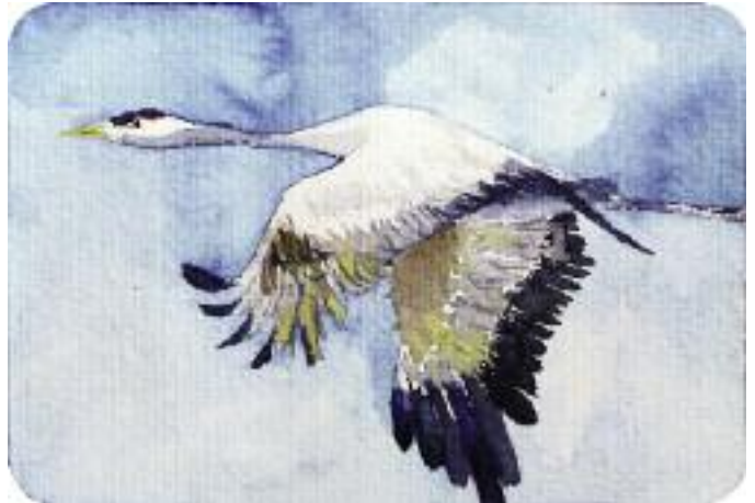
Kranich im Flug, 2011, Aquarellpostkarte 10,5 x 15 cm

Ich lebe in Mecklenburg Vorpommern und kann den Kranichzug im Frühling und Herbst „hautnah“ erleben. Im März kommen die Kraniche aus ihren Winterquartieren in Spanien, Frankreich und Nordafrika zurück. Die Rückkehr der Vögel des Glücks ist ein sicheres Zeichen dafür, dass der Frühling naht. Das ist ein wesentlicher Grund, warum die Menschen Jahr für Jahr die Kraniche mit Sehnsucht erwarten. Es ist ein wunderbares Erlebnis, die Vögel mit den ersten warmen Sonnenstrahlen auf ihrer Rast und bei ihrer Balz, dem Tanz der Kraniche, zu beobachten. Während der nächsten Monate machen sich die Vögel rar, denn sie sind mit der Brut und Aufzucht beschäftigt.